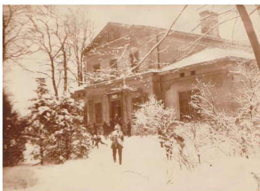
Budova Charlottenstiftu - leden 1922.