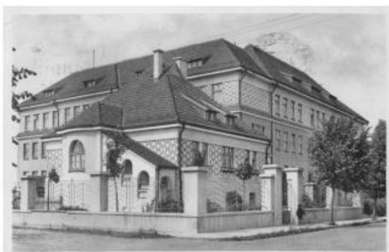
Gymnázium počátkem 30. let.