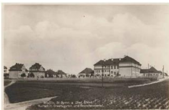
Gymnázium počátkem 30. let.