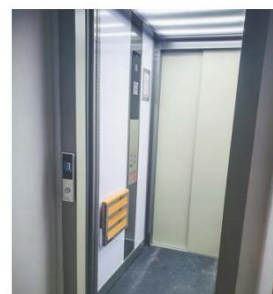
Bezbariérový výtah.