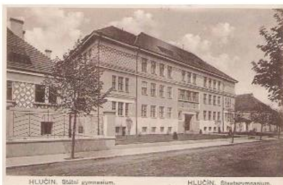
HLUČÍN. Státní gymnázium. HLUČÍN. Státní gymnázium.