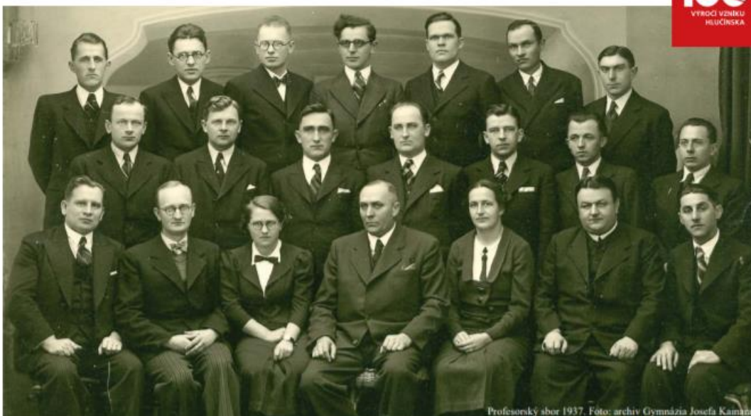
Profesorský sbor 1937.