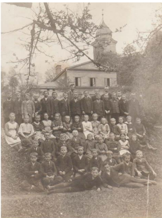
Třída prima - květen 1922.