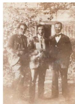
Profesorský sbor 1922.