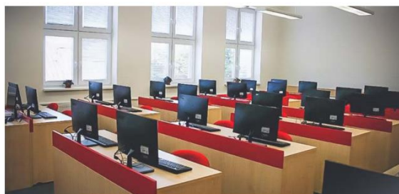
Modernizovaná počítačová učebna.

zaměřená na využívání nových metod a tabletů ve vyučování. Předmětem projektu IROP „Přírodní vědy moderně a bez překážek“ byla modernizace dvou přírodovědných učeben, pořízení moderního vybavení a učebních pomůcek a výměna plošiny za moderní výtah. Projekt byl spolufinancován Evropskou unií. Pro více informací navštivte naše webové stránky ( www.ghlucin.cz ) anebo naše sociální sítě.