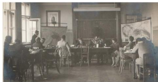
Maturitní zkoušky 1930.